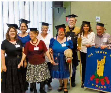
Die neuen Tower Mice des TV 1846.

BINGEN (söh) – „Freundlichkeit, Pflicht, Demokratie, Vergnügen“ – das sind die vier Grundpfeiler der Square Dance Gemeinschaft. Square Dancer in aller Welt leben danach. Bei der Graduation-Ceremony der Binger Tower Mice des TV 1846 werden sie durch vier Kerzen symbolisiert, die abgediente Mitglieder tragen. Die neuen werden von Kerze zu Kerze geführt, entzünden diese und bekommen noch einmal die Prinzipien der „Familie“ nahegebracht.